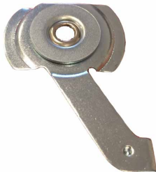
Schaarsteun voor in de dag montage