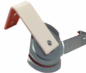
Wandsteun voor op de dag montage